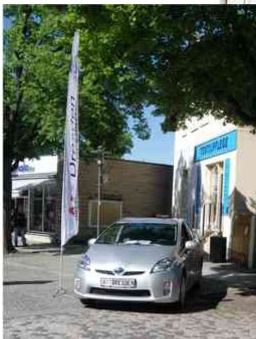
Ein Hybrid-Fahrzeug von Toyota, präsentiert von der AIS Dresden GmbH.