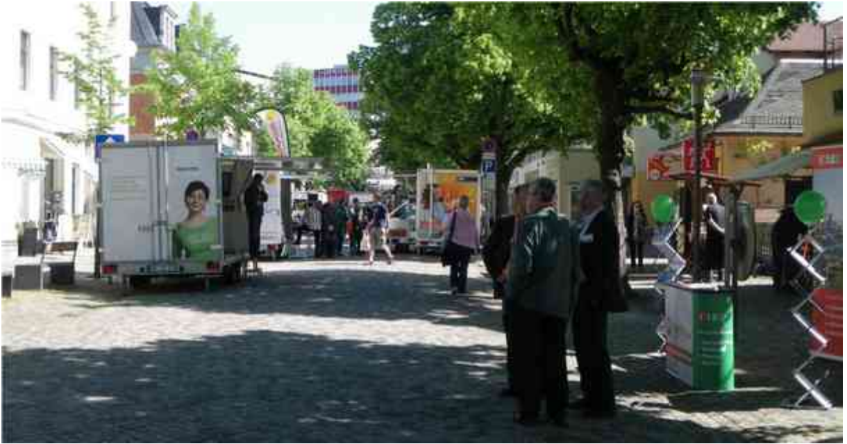
Blick auf die Hauptstraße mit 22 Ausstellern