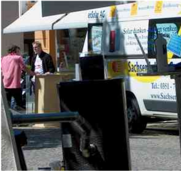
Die SachsenSolar AG zeigt PV-Systeme.