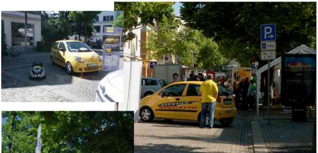
Elektroauto von CITYSAX