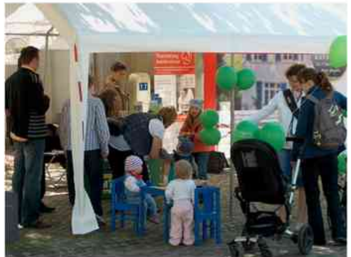
Die Kinderecke lockte auch so manchen kleinen Besucher.