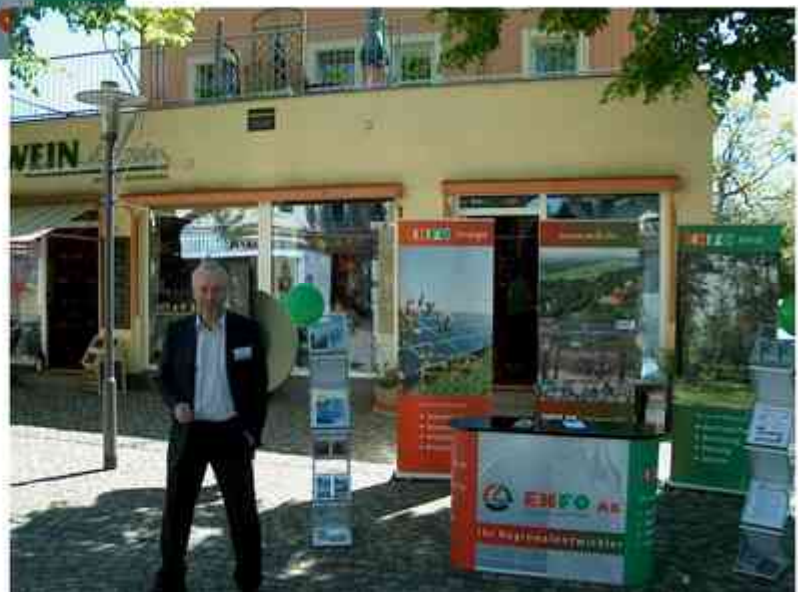
Die ENFO AG präsentierte Kauf- und Pachtangebote für Photovoltaikanlagen.