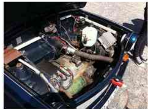
Ein Trabant mit E-Motor