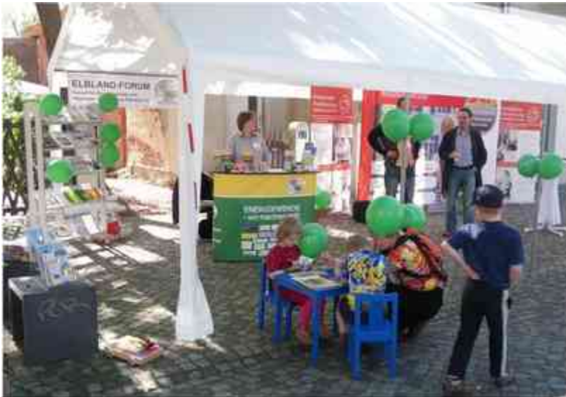
Das ELBLAND-FORUM und die Energieleitstelle Radebeul präsentierten sich gemeinsam unter dem großen Zelt.