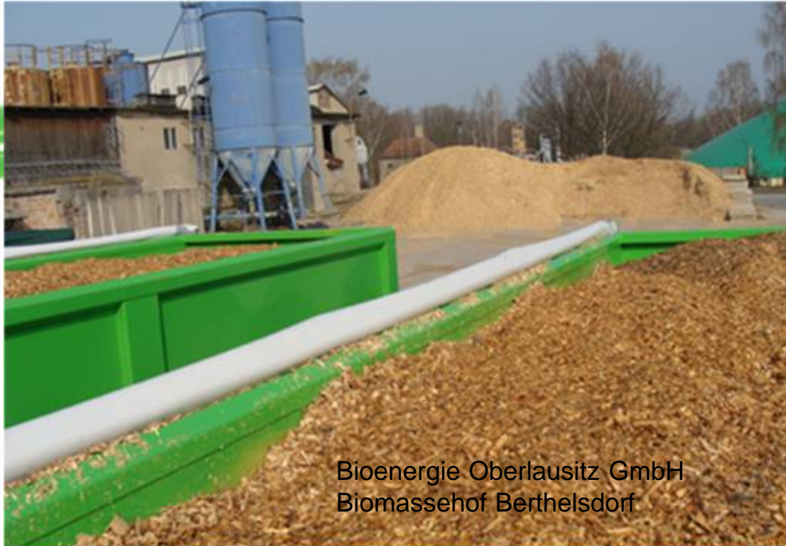
Bioenergie Oberlausitz GmbH Biomassehof Berthelsdorf