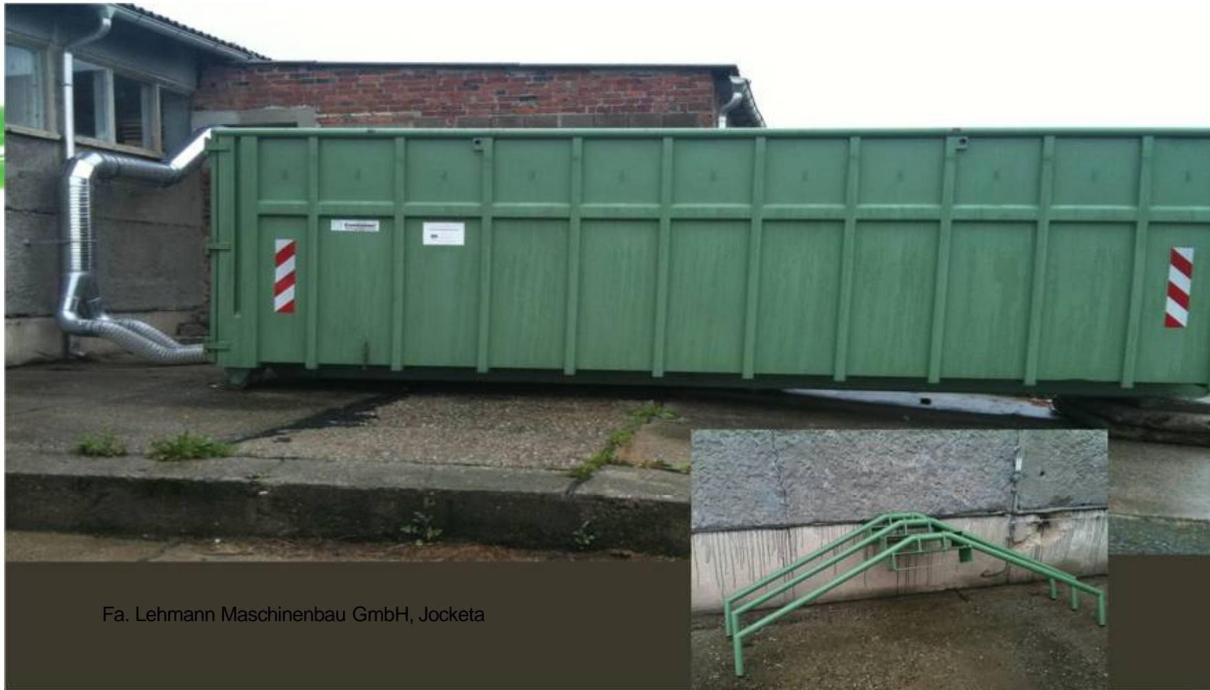
Fa. Lehmann Maschinenbau GmbH, Jocketa